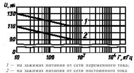
Предельные значения напряжения гармонических помех в полосе частот от 10 кГц до 30 МГц

1 — на зажимах питания от сети переменного тока; 2 — на зажимах питания от сети постоянного тока.